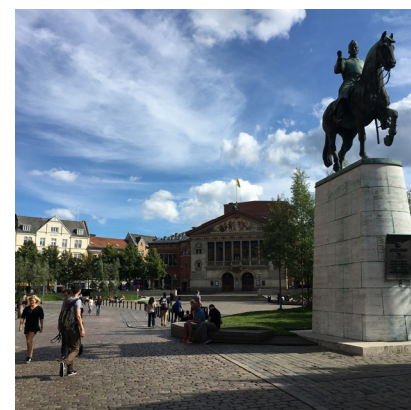
BISPETORY I AARHUS